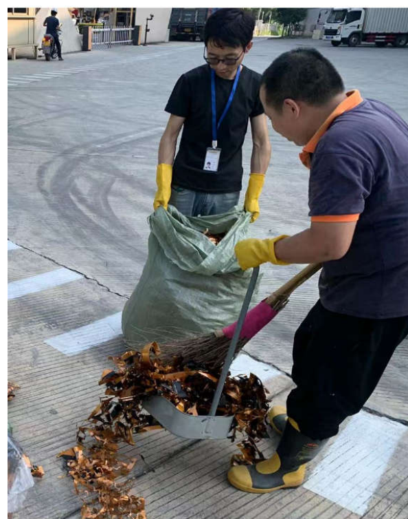
利用编织袋装卸料边角料