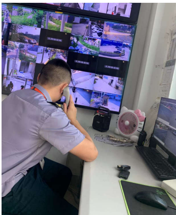
保安接到员工通报