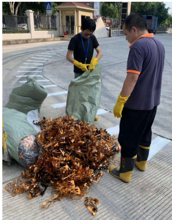
应急小组人员穿戴劳保品抵达