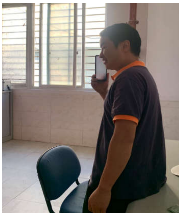
危废管理人员收到通报